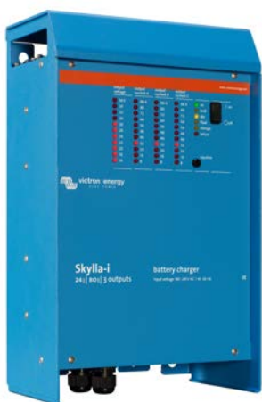
Skylla-i 24/100 (3)